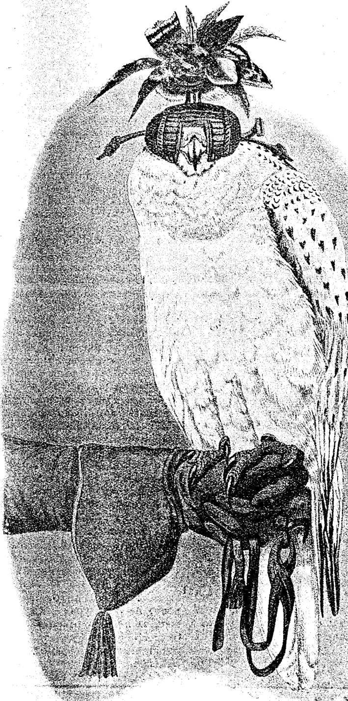
Накита и връзкитѣ на сокола.

Споредъ цѣльта, за която се обучава хищната птица, избира се и жертвата ѳ. Ако се желае соколѣтъ да бжде добъръ ловецъ, напр. на зайци, улавятъ единъ заекъ, счупватъ му изначало четиритѣ, крака, послѣ — третѣ и най-послѣ — само единиятъ