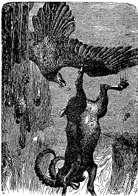
Ловъ на козирози съ дресиранъ орелъ.

Методата за дресирането на всички употребявани за ловъ хищни птици е една и сжща. Тя почива на слѣднитѣ основи: да се укроти смѣлиятъ и хрътниченъ хищникъ и да се накара да се подчинява на заповѣдитѣ на ловеца. Най-добритѣ соколи за ловъ сж тѣзи отъ една годишна възраст и слѣдъ тѣхъ младитѣ пилищи, едва що напустнали гнѣздото. За ловидбата на еднитѣ и другитѣ употребяватъ разни мѣрки съ стѣрвь, състояща се отъ живи гължби. Младитѣ соклета извадени отъ гнѣздото, обикновено, ставатъ мекошави и не ги бива за ловъ на едъръ дивечъ. Соколетъ, бидейки по естество свирепъ и недостѣпенъ за милувки, не може да се укроти друго яче, освѣнъ съ изтощаване и измжчване, като: лишение отъ свѣтлина, сънъ, почивка и храна. Ето защо, щомъ се улови единъ соколъ, веднага му се върватъ нозѣтѣ съ едни особени каиши, нарѣчени соколови връзки ; слѣдъ туй му