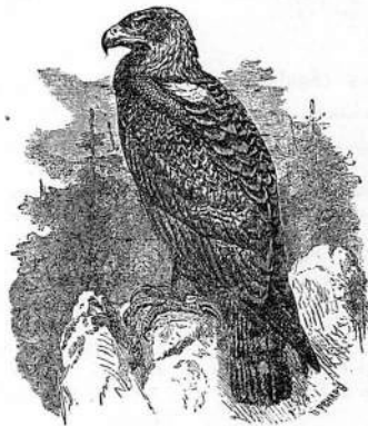
Рис. 1. Беркутъ ( Aquila chrysaetus L.).

тель степенъ и лѣсовъ, а второй—беркутъ горный—обитатель горныхъ странъ. Настоящій очеркъ и посвящаю (рис. 1) орлу беркуту ( Aquila chrysaetus L.) 1) . Въ нашемъ отечествѣ область географическаго распространянія орла беркута весьма обширна. Въ Европейской Россіи сѣверная граница распространянія достигаетъ широты Лапландіи и, можно утвердительно сказать, подвигается на этой широтѣ съ запада на востокъ, повсюду