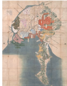
尾張家御鷹場絵図 江戸時代 18~19世紀