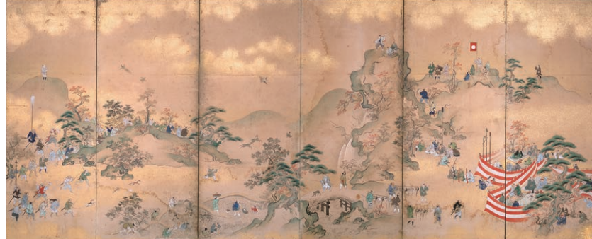
鷹狩図屏風 六曲一双の内 左隻 江戸時代 18世紀 斎藤芳克氏寄贈