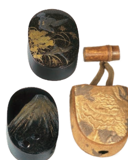
黒塗蒔絵銅合子・覆 (鷹狩道具一式の内) 徳川慶勝(尾張徳川家14代)所用 江戸時代 18~19世紀