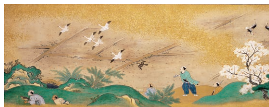
鷹狩絵巻 二巻の内 上巻(部分) 江戸時代 17~18世紀 (徳川林政史研究所蔵)