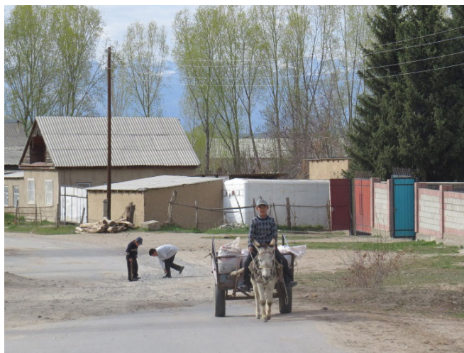
Фото 1. с. Чельпек, 2012.