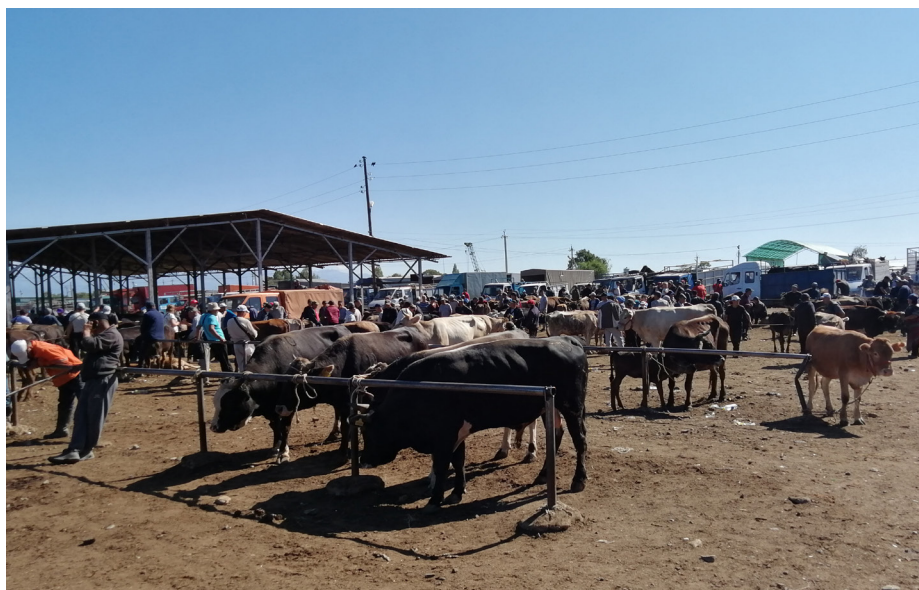
Фото 3. Скотный рынок «Мал базар». Июль 2021 г. г. Каракол.

В настоящее время наблюдается рост численности частных животноводческих хозяйств у сарт-калмыков. Современные скотоводы с апреля по сентябрь выпасают свои стада на летних пастбищах (жайлоо 'летовка', по-сарт-калмыцки зуслң 'летовка') в высокогорном районе в Ак-Сайских сыртах (сырт кирг. 'высокогорная долина'), находящемся к югу от Ат-Башинского хребта в одной из самых высоких межгорных впадин Внутреннего Тянь-Шаня. В октябре, с наступлением холодов в горах, скотоводы спускаются с летних пастбищ в села, где к этому времени уже заготовлены корма.