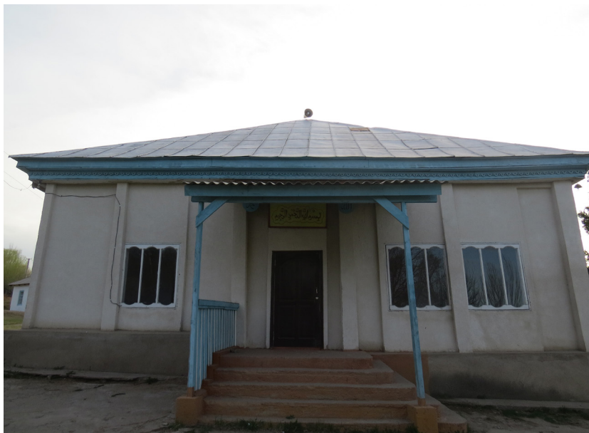
Фото 4. Мечеть 1889 г., с. Чельпек, 2021 год.

Однако в связи с тем, что носителей родного языка, знатоков фольклора и традиционных обрядов среди сарт-калмыков осталось очень мало, существует определенная трудность сбора полевого материала. Тем не менее, в ходе экспедиции 2021 г. мы сумели записать устные рассказы об истории, этническом составе, традициях, религии сарт-калмыков, топонимы, легенды, песни, благопожелания, пословицы, поговорки и др. Удалось найти копию рукописного «Сарт-калмыцко-киргизско-русского словаря», составленного сарт-калмыками. В настоящее время это единственный лексикографический источник по языку сарт-калмыков.