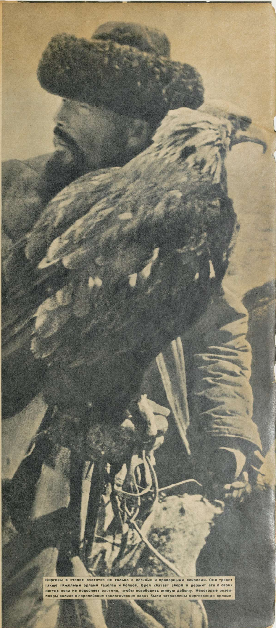
Киргизы в степях охотятся не только с легкими и проворными соколами. Они травят также тяжелыми орлами газелей и волков. Орел хватает зверя и держит его в своих когтях пока не подоспеет охотник, чтобы освободить живую добычу. Некоторые экземпляры волков в европейских зоологических садах были затравлены киргизскими орлами.