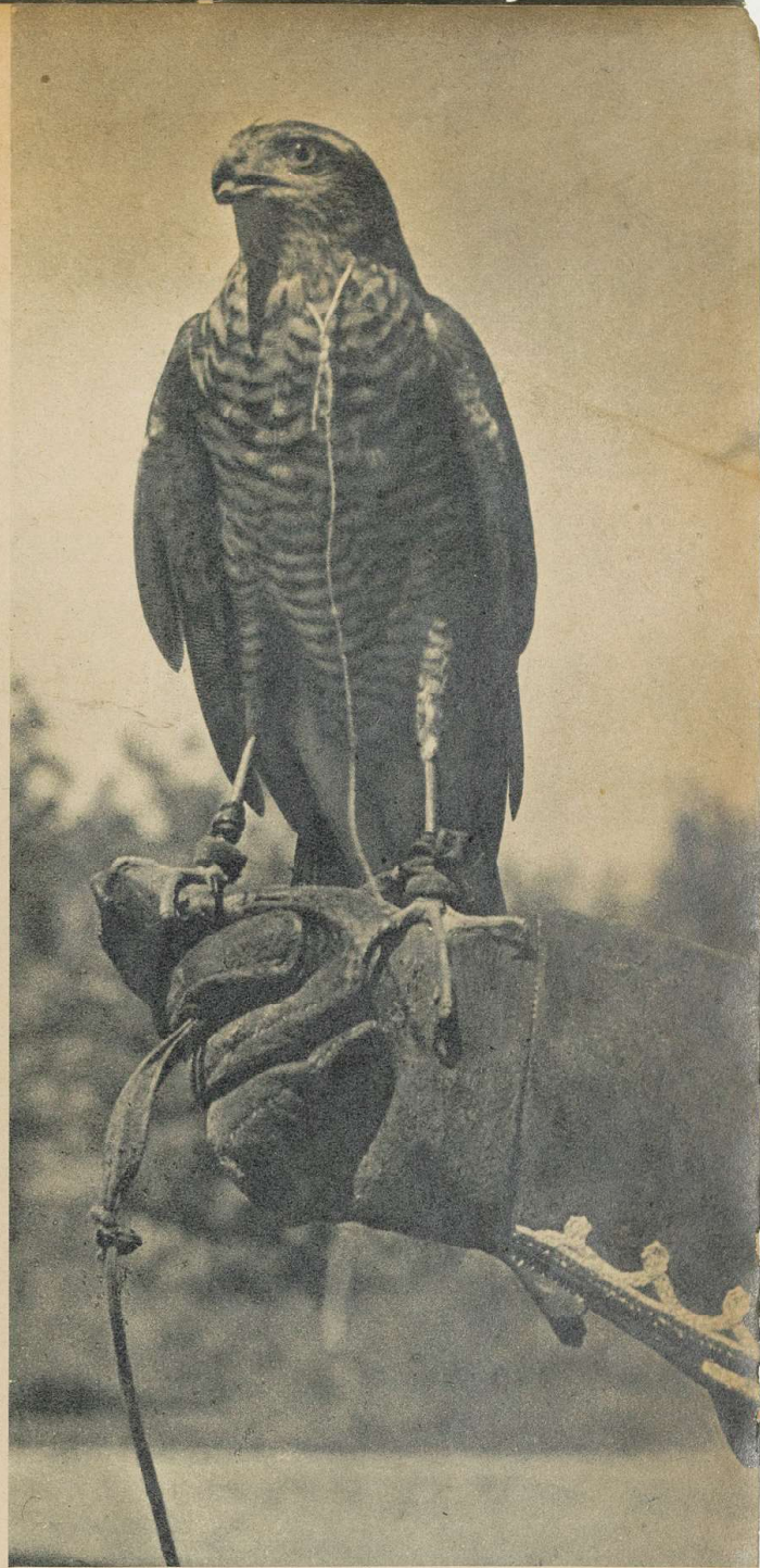
В Азии занимаются соколиной охотой и по сей день. Бла городской сокол на руке иранского охотника в ожидании появления добычи и приказа от своего господина.