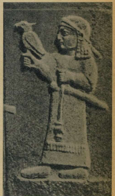
Древние египтяне обоготворяли соколов и бальзамировали их. По изображению времени древних хеттитов видно, что и тогда существовала соколиная охота.