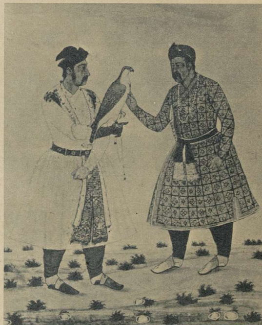
Монгольская династия императоров в Индии хранила благородный обычай. Великий Могол Акбар дарит своему сыну ценного сокола.