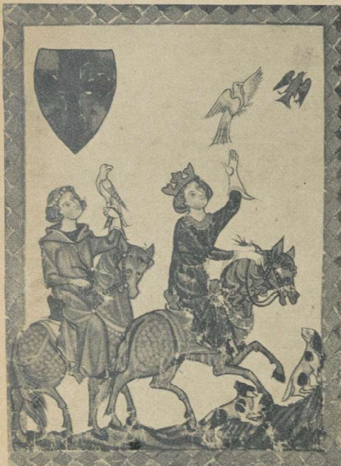
Императоры, короли и церковные князья занимались соколиной охотой. На рисунке король Конрад Младший выпускает своего сокола на добычу.

ву, у наблюдателя захватывает дух. Представьте статного сокола, который с быстротой 90 метров в секунду, со свистом рассекая воздух, падает на испуганную добычу. Царственная птица может травить только в воздухе. Едва коснувшись земли, она разбилась бы на смерть. Один германский солдат, по-