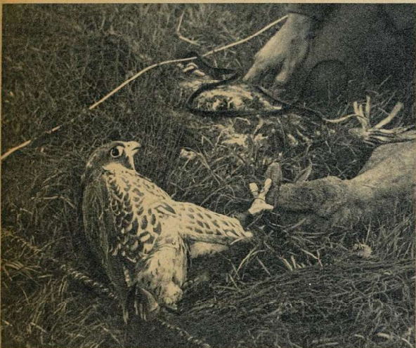
Сокол освобожден от сетей. Свои когти он глубоко запустил в перчатку ловца, но вырваться ему невозможно, так как птица уже прикована.

павший в плен во время первой мировой войны, научился у киргизов 'соколиной травле. Вернувшись на родину, он начал обучать этому старому искусству своих соотечественников, и в Германии снова возродился интерес к соколиной охоте.