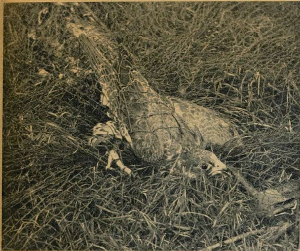
Соколиные охотники начинают приучать к травле еще не умеющих летать птенцов. Но лучше всего, когда попадает в сети опытная птица.