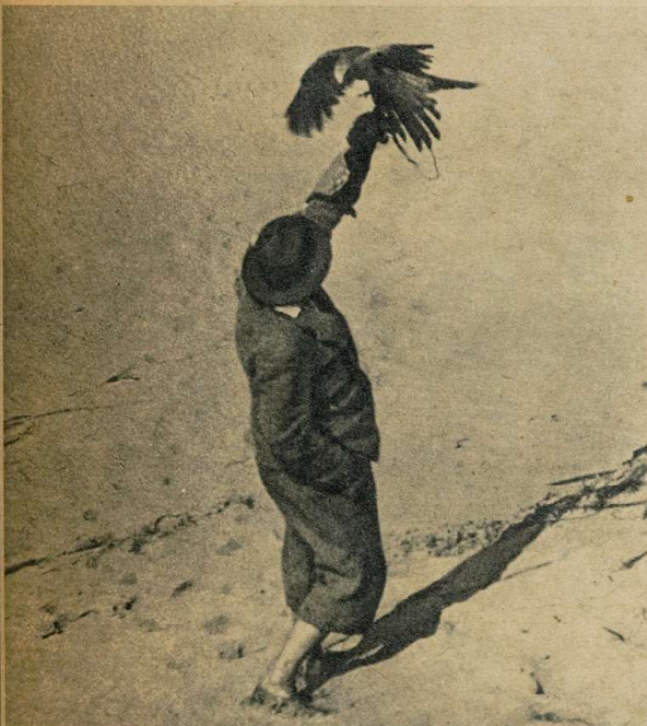
Сокол поступает в серьезную выучку. Птица должна привыкнуть возвращаться всегда к своему господину. Рука господина — это старт и финиш воздушного боя.

павший в плен во время первой мировой войны, научился у киргизов 'соколиной травле. Вернувшись на родину, он начал обучать этому старому искусству своих соотечественников, и в Германии снова возродился интерес к соколиной охоте.