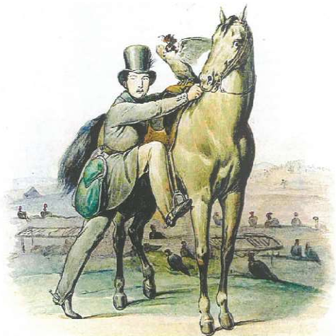
Aquarel door Johan Sonderland (Koninklijk Archief)

In 1855 is het sprookje uit. Plotseling – naar Mollen het doet voorkomen – slaan de valkeniers op straat. Hebben zij de bui zien aankomen of hebben zij misschien gedacht dat de vorst de tekorten wel zou blijven aanvullen? Het is niet waarschijnlijk dat mannen die de teruggang van de valkerij in heel Europa hebben gezien en in Engeland in eigen persoon hebben meegemaakt nu onverheelds door het lot worden geslagen. Het kan hen toch niet ontgaan zijn dat de voor de jacht zo ideale locaties in cultuur worden gebracht. In 1847 brengt de Ordermark haar uitgestrekte heidevelden langs de Soerense grintweg in publieke verling. Hierdoor gaan zij voor de jacht verloren. Daarnaast worden de reigers schaarser. Als het jachtseizoen enige weken oud is zoeken de reigers al in nadering van de stoet een schuilplaats. De instinctmatige gehechtheid aan hun nesten verloochenen zij voor veiliger oord. In 1849 zit er een hele kolonie vangen in de bossen van het kasteel Biljoer te Velp, waar zij eerder slechts zelden werden gesigaleerd. Aan hun koperen reigerbarden is te zien dat de daar geschoten exemplaren al eens op het Loo zijn gevangen.