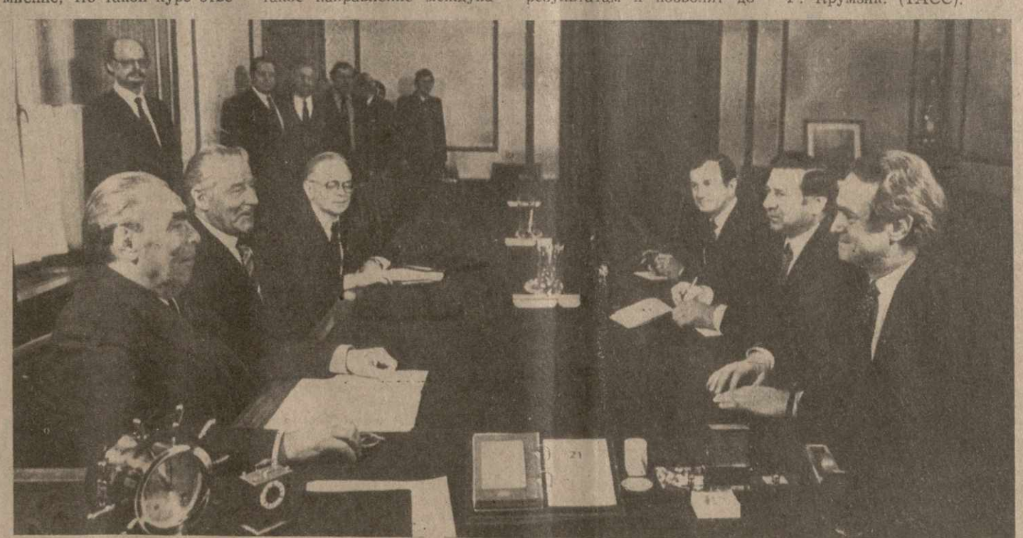
Во время беседы.

Было выражено единое мнение, что такой курс отве-