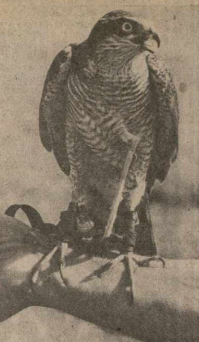
На снимках: члены жюри оценивают достоинство зайлевых на соревнованиях ласточек; астреб-перелетчик на руке охотника.