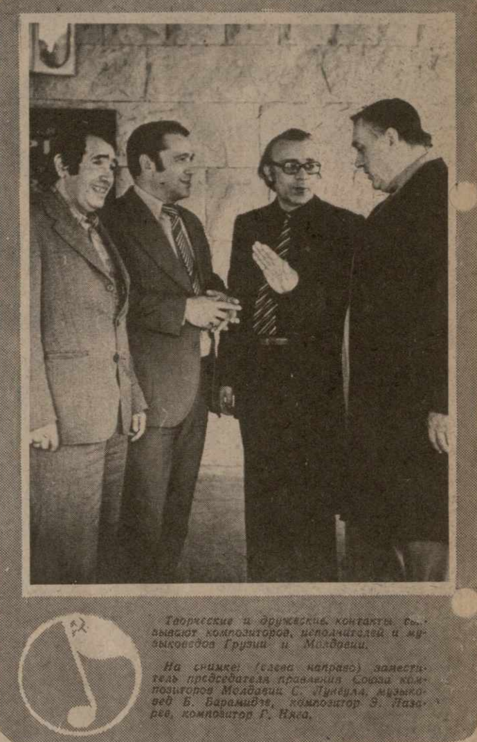
Творческие и дружеские контакты выявляют композиторов, исполнителей и музыковедов Грузии и Молдавии.