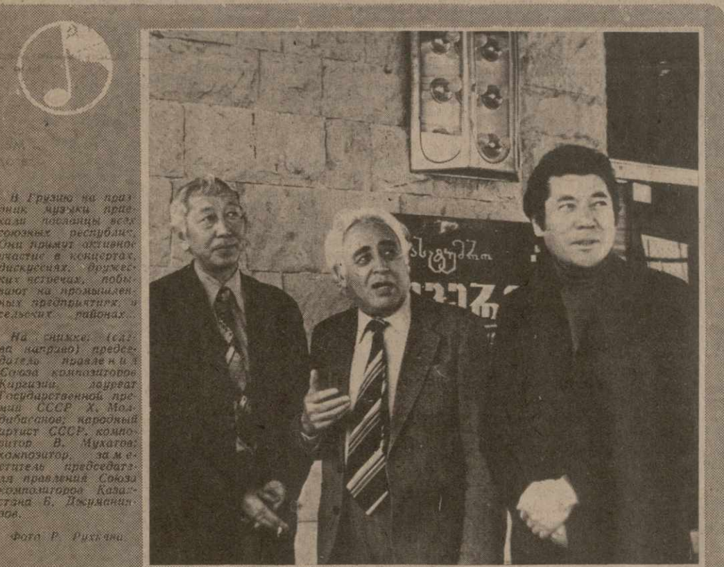
В Грузии на празднике музыки привели в исполнение все союзных республик. Они приняли активное участие в концертах. Директор филармонии Тбилиси, народный артист СССР, лауреат Ленинской и Государственных премий СССР, Г. Свиридов, главный режиссер Большого театра Союза ССР, художественный руководитель Московского камерного музыкального театра, народный артист СССР, лауреат Ленинской и Государственных премий СССР, Б. Покровский.

У нас есть все основания сказать, что советско-болгарские отношения, построенные на принципах полного равноправия, взаимного уважения, искренней дружбы и товарищеской взаимопомощи, на принципах социалистического интернационализма, стали одним из примеров подлинно братских связей между странами социализма, сказал в заключение глава советской делегации.