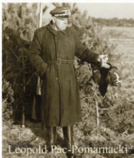
Leopold Pac-Pomarański POCZTA POLSKA S.A. 350g a