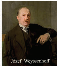
Józef Weysenhoff POCZTA POLSKA S.A. 350g a