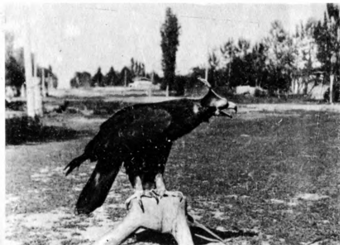
Беркут на подставке-треноге

Затем беркута усаживали на некотором расстоянии от хозяина, показывали ему кусочек мяса и подзывали призывом: «кыйту». После этого птицу начинали обучать охоте на движущемся предмете: вначале на куске мяса, привязанном к веревке, а затем на чучеле, сделанном из жеребьячьей шкуры, с прикрепленным к нему лисьим хвостом.