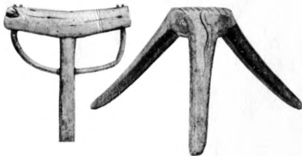
Подставки-наседы для беркутов

Дома беркута привязывали длинной веревкой и сажали на специальную подставку. Чтобы успокоить птицу, ей на голову надевали кожаный колпачок-шапочку, закрывавший глаза. Кормили птицу свежим, вымоченным в воде, постным, несоленым мясом, давая его из рук. До года беркуту в течение дня давали, примерно, 300 г мяса, а после года — один килограмм. Чтобы приручить к себе птицу, охотник старался чаще бывать около нее, осторожно поглаживал ее, носил на руке.