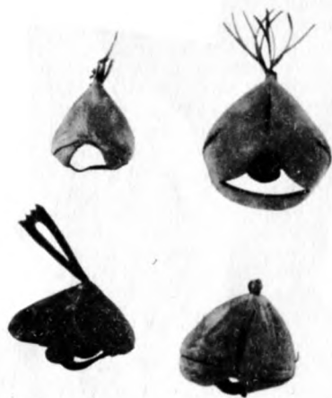
Колпачки на голову ловчих птиц

Охотники предпочитали дрессировать не птенцов, а взрослых птиц, так как их дрессировка длилась вдвое меньше.