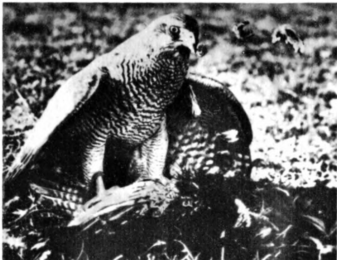
Сокол с добычей

щим охотником дичью. Когда молодой охотник приносил первую крупную дичь, устраивали праздник, на который приглашались все соседи и старые охотники. Для угощения резали барана или козу. Тот, кто обучал охотника, слегка прикусывал большой палец правой руки своего ученика, желая ему быть удачливым, советовал заботливо относиться к своему беркуту, никогда не бить его, вовремя поить и кормить, оберегать его. После такого наказа он благославлял юношу, и с этого времени тот уже становился полноправным охотником.