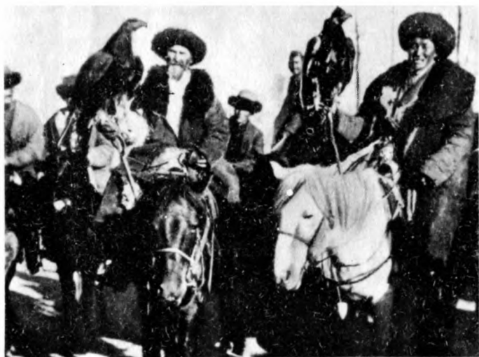
Охотники с беркутами

Перед охотой ловчих птиц кормили совсем немного. Для охоты с беркутом выбиралось высокое место, с которого хорошо просматривались все окрестности. Охотники часто выезжали группами по 3—5 человек. Беркута сажали на правую руку, на которую надевалась специальная рукавица.