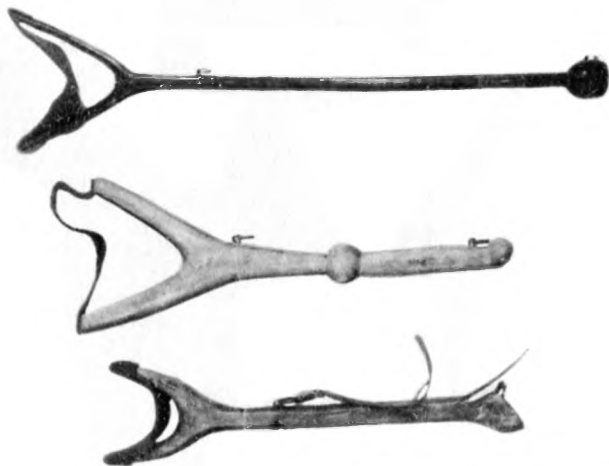
Подставки-опоры для руки охотника

Ястребов и соколов отлавливали сетью с приманкой — привязанной птицей. Существовал и другой способ: замеченную с вечера птицу ловили затягивающейся петлей, привязанной к длинному шесту. Для этого охотники приходили ночью к дереву, где сидела птица, ослепляли ее факелом, а затем накидывали на нее петлю.