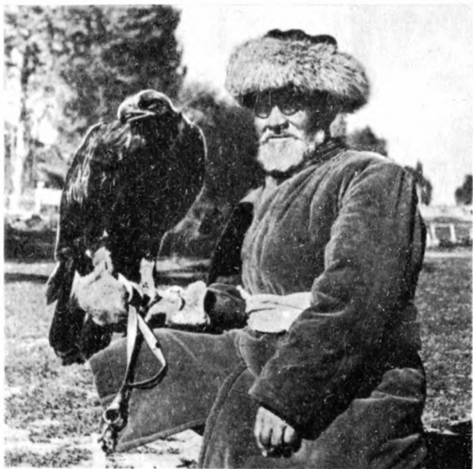
Охотник с беркутом

Ястребов и соколов отлавливали сетью с приманкой — привязанной птицей. Существовал и другой способ: замеченную с вечера птицу ловили затягивающейся петлей, привязанной к длинному шесту. Для этого охотники приходили ночью к дереву, где сидела птица, ослепляли ее факелом, а затем накидывали на нее петлю.