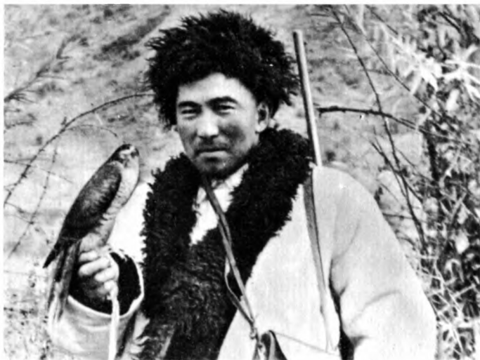
Охотник с ястребом-перепелятником

Поймав ястреба или сокола, крепкой ниткой или конским волосом прошивали веки птицы одним стежком. Эти нитки снимали через несколько дней, когда птица уже привыкала к хозяину. На Тянь-Шане появление у охотника ястреба-тетеревятника отмечали праздником, который назывался «Смазывание жиром хвоста ястреба». На него охотник приглашал большое количество гостей, резал скот для угощения. Ястребу слегка смазывали жиром хвост, чтобы ястреб «хорошо охотился».